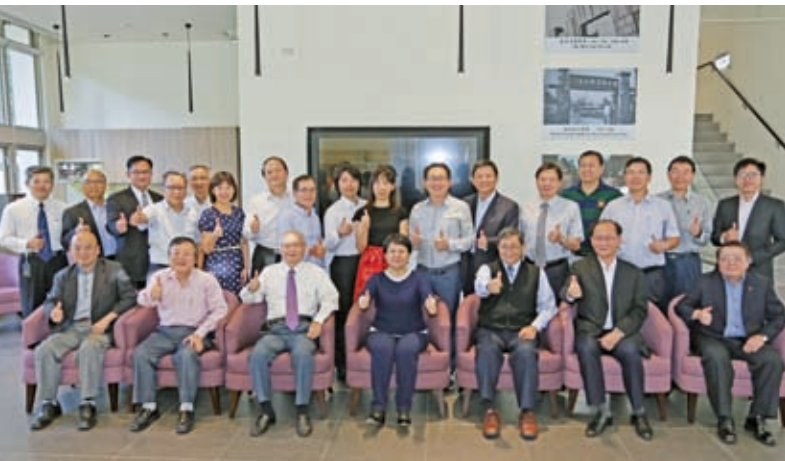
第七屆第一次理監事會